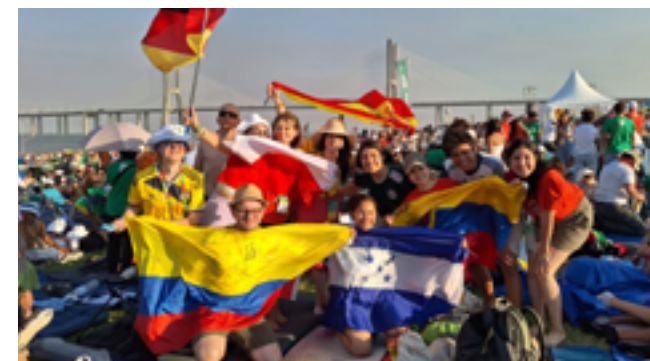
links: Besuch in Fatima und Beten für die Anliegen der Gemeinde rechts: Messe mit dem Papst

zum Nachdenken an. Doch der Weltjugendtag wäre nicht der Weltjugendtag ohne die spektakulären Mega-Events, wie die Begrüßung des Papstes und der von ihm und den Christen aller Welt begleitete Kreuzweg. Das Finale bildete dann die Übernachtung auf freiem Feld, die Abendvigil mit dem Papst und der Abschlussgottesdienst. Mit den Worten „Fürchtet Euch nicht“ entsendete er uns junge Pilger hinaus in die Welt mit dem Auftrag, unsere Freude am Glauben der Welt zu verkünden.