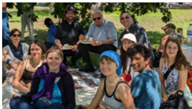
links: in Lissabon rechts: Picknick mit dem Erzbischof während der Tage der Begegnung in Marinha Grande (Bistum Leiria-Fatima)

tage. Ganz getreu dem Weltjugendtagmotto „Maria stand auf und machte sich eilig auf den Weg“ begaben wir uns am folgenden Tag auf eine Lichterprozession durch die gesamte Stadt, wo wir in Gemeinschaft mit den Einheimischen den Rosenkranz beteten.