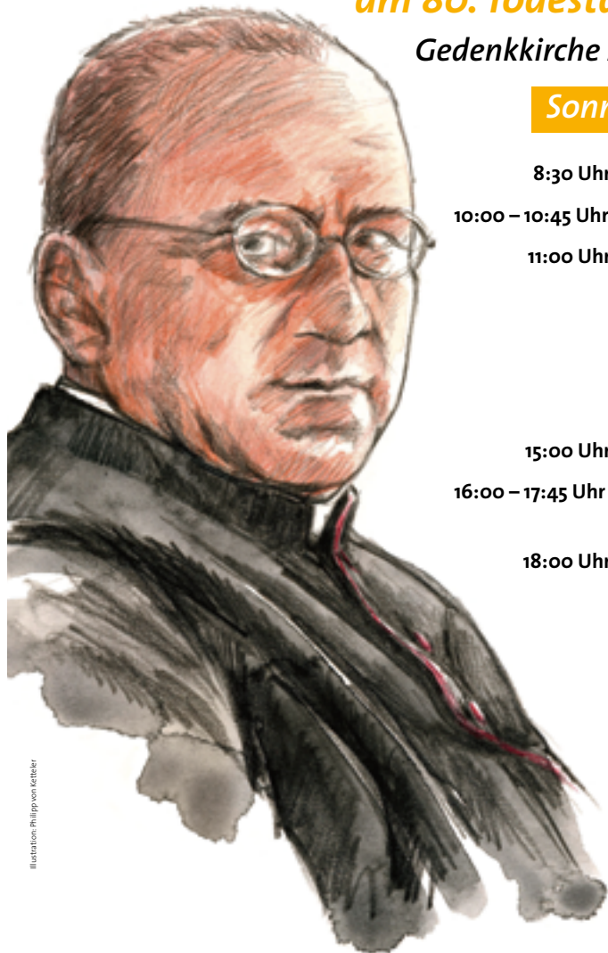
Illustration: Philipp von Kettner

In seiner Predigt im feierlichen Requiem sagt der Bischof: „Frater Fortunatus hat ein heiligmäßiges Leben geführt. Beten wir dafür, dass er bald zum „Seligen“ erklärt wird.“