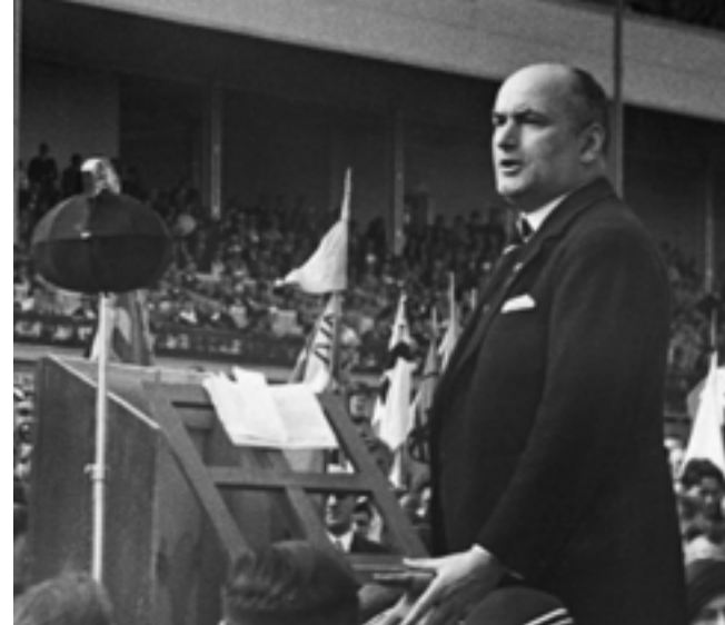
linke Abb.: Dr. Erich Klausener in Hoppegarten am 24. Juni 1934